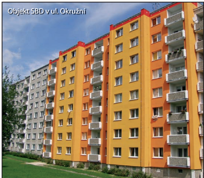
Objekt SBD v ul. Okružní

Klášterce n.O. digitálním signálem. Barevné plochy ukazují, jaká anténa bude potřebná k příjmu signálu. Pro detailnější studium si můžete kliknout ve svém počítači na níže uvedenou, poměrně dlouhou webovou adresu, kde najdete i další informace. Petr Auf www.cra.cz/cs/domacnosti/vysilani/mapa-dostupnosti-sluzeb/mapa-pokryti-sluzeb-cra.ep/