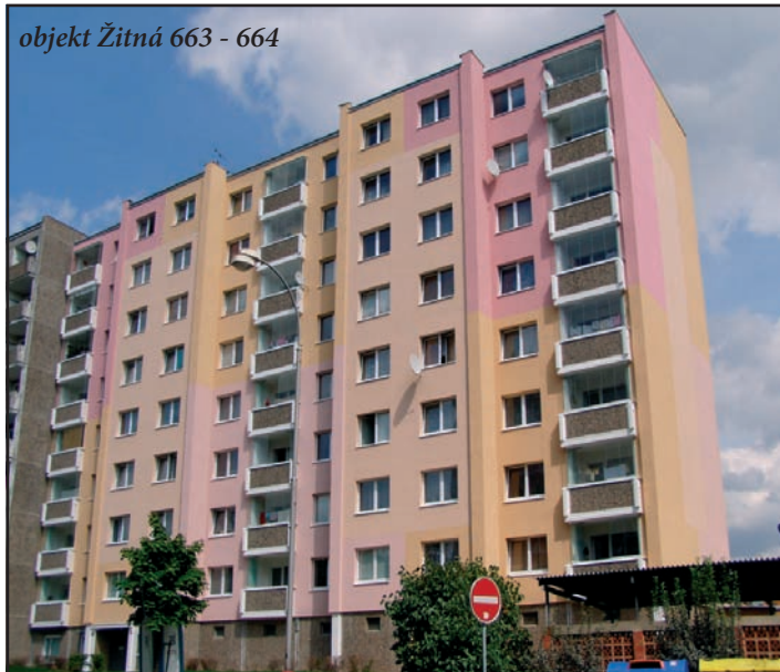
objekt Žitná 663 - 664