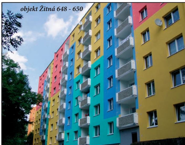
objekt Žitná 648 - 650