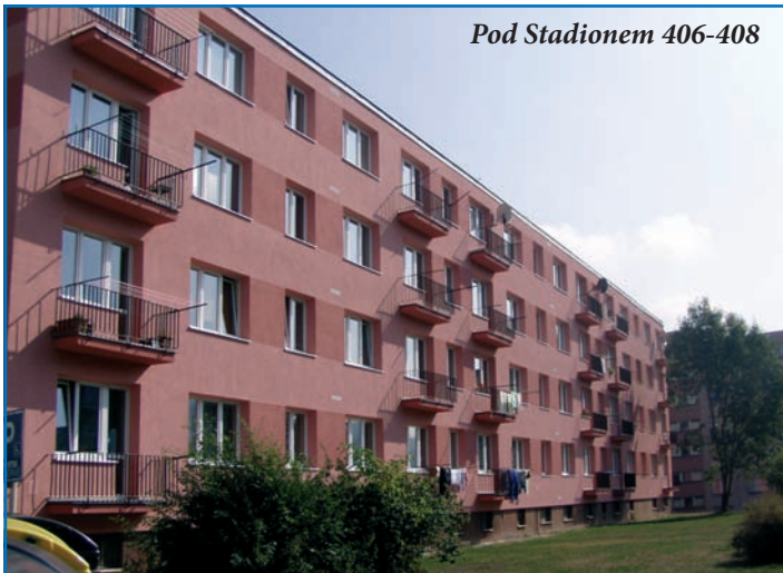
Pod Stadionem 406-408

- SV - náklady na odběr SV pro byt jsou počítány součinem jeho odběru naměřeného vodoměrem ... (pokr. na str. 2)